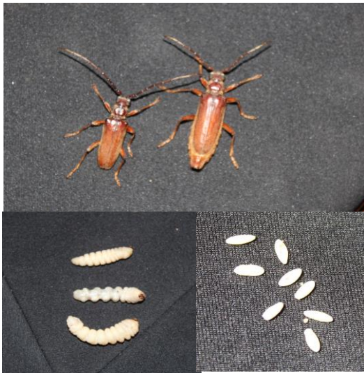
دورة حياة حفار ساق النخيل ذو القرون الطويلة (بيضة، يرقة، حشرة كاملة)