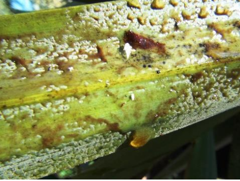
بالغات وحوريات حشرة الدوباس على النخيل